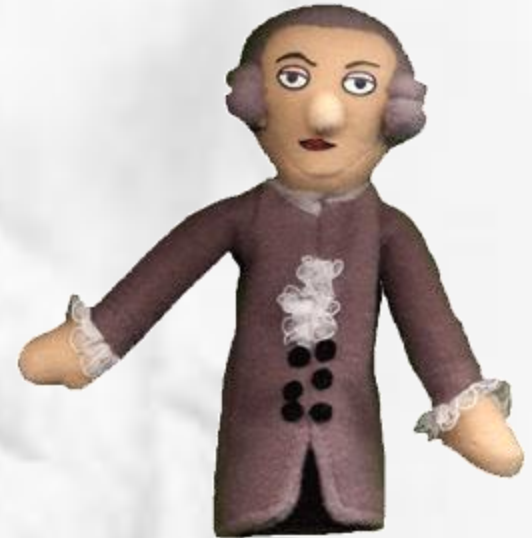
”The Immanuel Kant fingerpuppet”